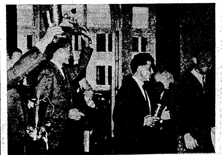
W sali NOT w Warszawie odbyło się rozdanie nagród uczestnikom X Wyścigu Pokoju. Na zdjęciu: drużyna NRD z trofeami za zwycięstwo zespołowe