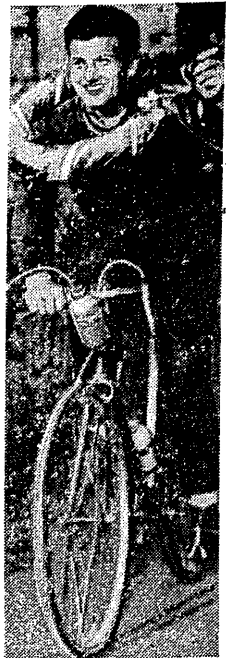
Went o Christow - to szczęśliwy niedziela. Lider Wyciągu Pokoju po dwóch etapach nie tylko utrzymuje żółtą koszulkę...