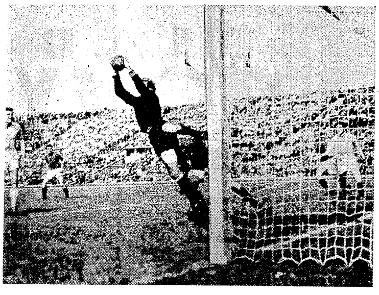
Fragment spotkania o mistrzostwo I ligi piłkarskiej Górnik Zabrze — Polonia Bytom 3:1