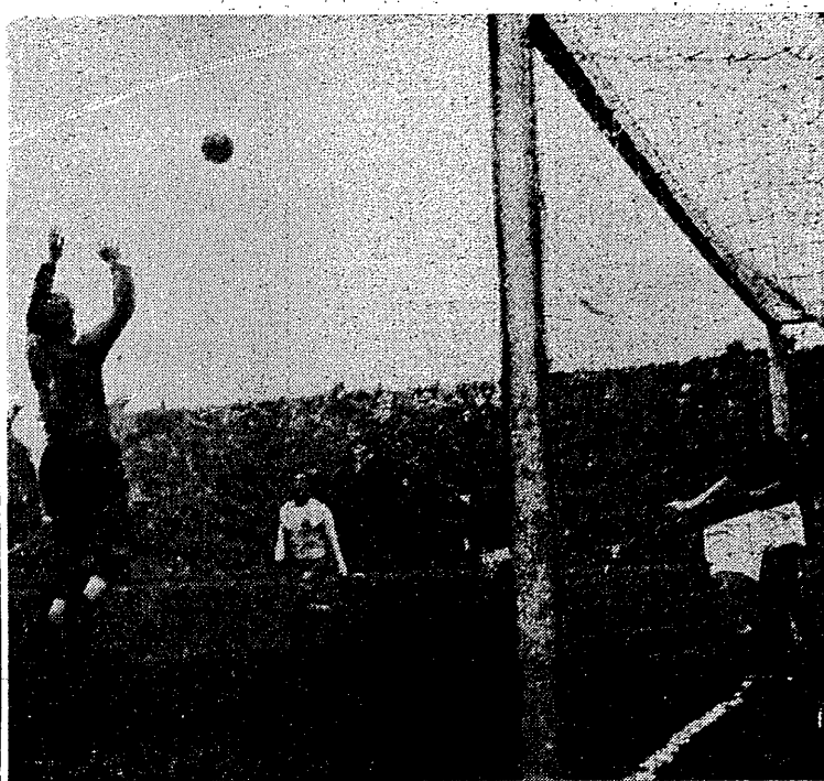
Ruch Chorzów zagrał dobrze, ale niewiele mógł wskórać w walce z 20-krotnym mistrzem Austrii — Rapidem Wiedeń. Wynik ostateczny 4:0 dla Austriaków.

RAPID: Zeman (Gartner), Hölt, Happel, Lentzger, Hanappi, Bilek (Gieser), Halla, Riegle, (Mesaosch) Kasamus, Köner II, Schafrenk.