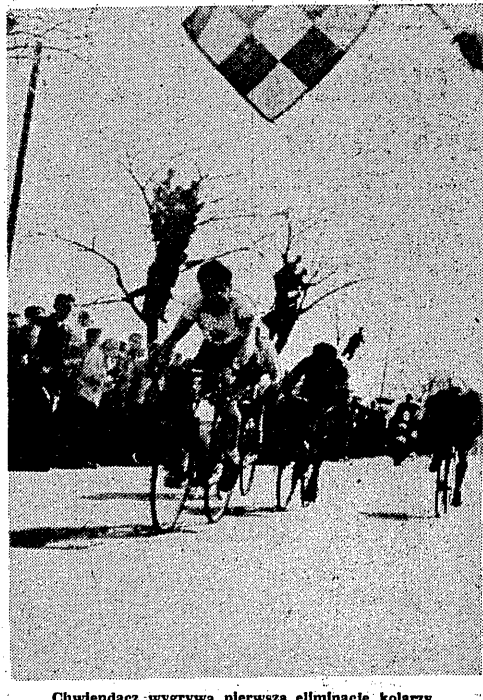
Chwiendacz wygrywa pierwszą eliminację kolarzy