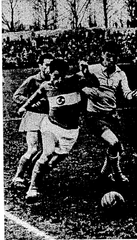
Ostatnim egzaminem młodych piłkarzy przed turniejem FIFA był mecz z Turcją, wygrany 2:1