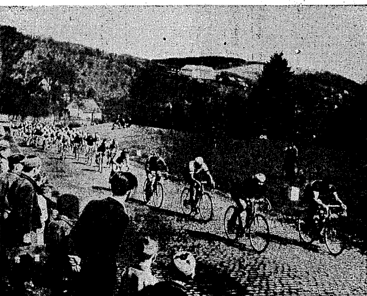
Na trasie wyścigu eliminacyjnego

W jakim stopniu przewidywania nasze są słuszne, otrzymamy na to odpowiedź już w sobotę. Trzeba oczywiście zwrócić jeszcze pod