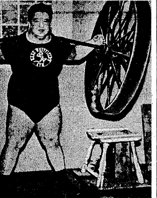
Jeden z najcięższych, ale i najsilniejszych ludzi świata Paul Andersonson (USA) podczas zajęć treningowych