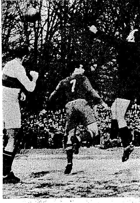
Młody bramkarz Ilku (z prawej) przewidywany jest przez fachowców węgierskich na następcę „wielkiego” Grosicsa