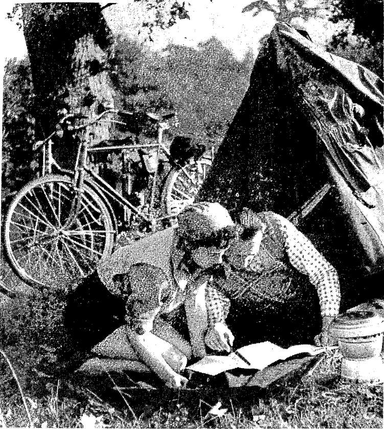
Można się wybrać na wędrowny kurs instruktorski dla przewodników turystyki kolarskiej, można podróżować indywidualnie, tak jak ta sympatyczna para na naszym zdjęciu. Sprzęt turystyczny w tym sezonie nie zagraża dla nikogo, o czym dowiedzieć się z naszego kącika na str. 2