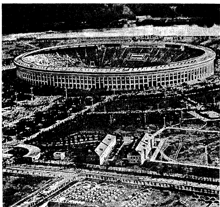
Widok z lotu ptaka na stadion im. W. Lenina w Moskwie, gdzie odbędą się III MISM