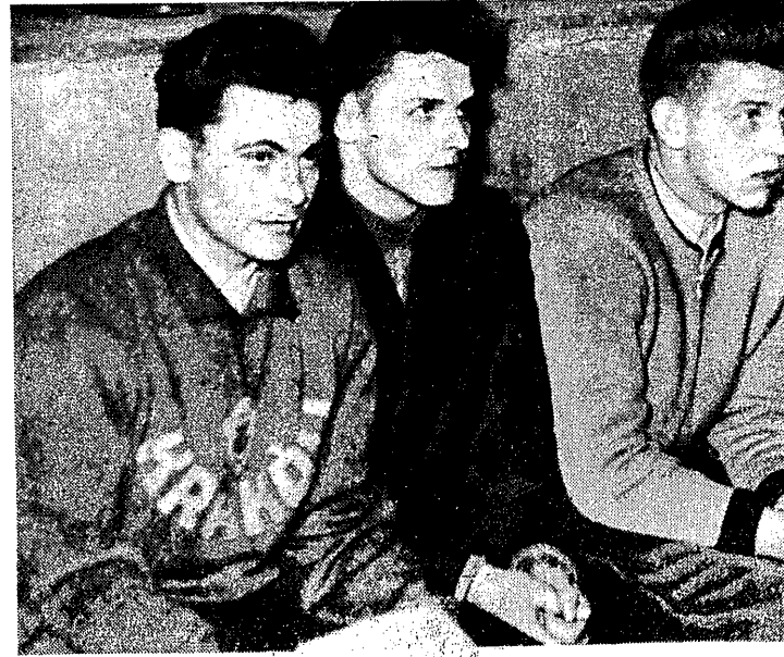
Trójka mistrzów Polski juniorów. Od lewej: Kuśmierz Kraków, Bowszyc Olsztyn i Plotowicz Głanisk