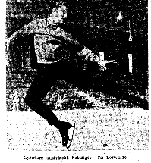
Zywiąrz austriacki Folsinger na 10rwa-ze