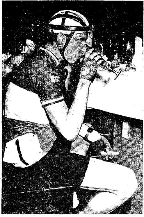
Ostatnie chwile odpoczynku do IV etapu w IX Wyścigu Pokoju. Na pierwszym planie Anglik Britain.