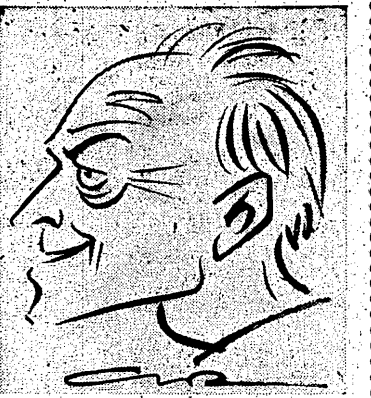
Minister oświaty Władysław Bieńkowski

Z ministrem Bieńkowskim przebrałem dwukrotnie na 60 m na mistrzostwach szkolnych w roku... bardzo w każdym razie dawno, ale tym razem postanowiłem wygrać... i wywiad na temat wychowania fizycznego i sportu w szkole, w okresie gdy sprawy te tak gorąco są dyskutowane — od ministra usłyszałem.