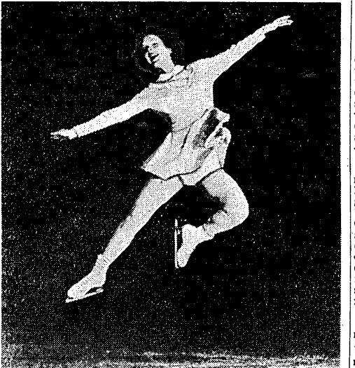
21-letnia Tenley Albright, mistrzyni świata z 1955 r. i mistrzyni olimpijska 1956 r. zamierza zdobyć jeszcze raz tytuł mistrzyni świata, a potem przejść na zawodowstwo.