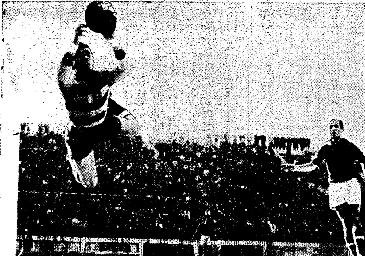
Fotoreporter, który wykonał to zdjęcie, miał dużą szeszczała umiejętności fachowych. Działając to bowiem na meczu, a nie podczas treningu, kiedy bramkarz, może specjalnie „pozować” do efektownego zdjęcia.

W konkursach biegowych kobiet sprawa stała się zupełnie jasna. Reprezentantki Związku Radzieckiego są w tej chwili o klasę lepsze od wszystkich biegaczek świata.