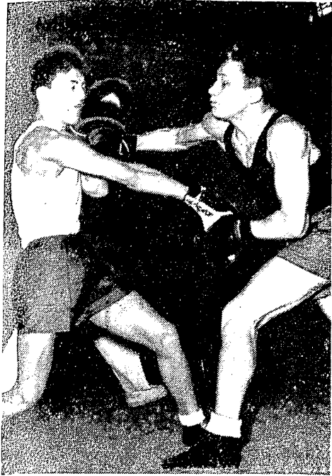
Młode zawodniczki Startu z Grochowa Niezawiedzi (z prawej) wypunktowały zawodniczkę Legii Kurhana. Była to jedna z najbardziej widowczych walk finałów mistrzostw Warszawy junierek.