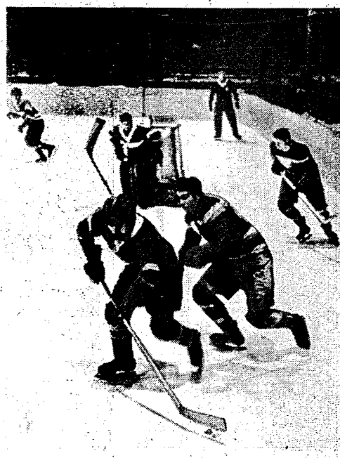
Fragment spotkania Spartak Moskwa — Polska, zakończonego zwycięstwem drużyny radzieckiej 4:0.