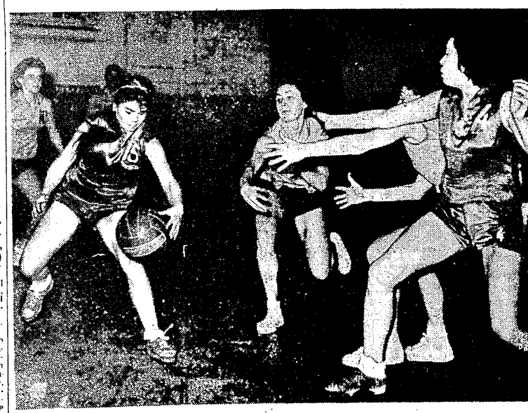
Jedno ze spotkań turnieju koszykówki kobiet rozegranego w Warszawie. Grają Gwardia W-wa i CWKS Kraków.

PP Totalizator Sportowy zawiadoma, że na V Zakłady na dzień 24 lutego, polegające na oddaniu-ciu wyników piłkarskich, wpłynęło 356.540 rozwiązań. Na Zakłady VI na 24 bm., polegające na oddaniu wyników hokejowych mistrzostw świata, wpłynęło 166.581 rozwiązań. PP Totalizator Sportowy zawiadoma, że wszystkie rozwiązania nie posiadające symbolu zakładów — nie oznaczone „Piłka nożna” lub „Hokej” — zgodnie z podanym uprzednio komunikatem — zostały uwzględnione z wyjątkiem tych, do których nieczynny Totalizator nadałaby listownie uzupełnienie do dnia 24 bm. godz. 10. Na konkurs „Toto-Lotek” na 24 bm. wpłynęło 83.938 rozwiązań. Publiczne losowanie „Toto-Lotek” odbyło się 24 bm. w przewnie meczu piłkarskiego Górnik Zabrze — Vasas Cespi. Losowania dokonał zawodnik Górnik Dębink, który wylosował następujące dyscypliny: gimnastyka, koszykówka, strzelectwo, żużel, hokej na trawie i siatkówka. Dokończenie na str. 4