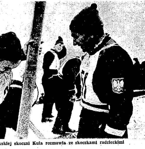
Przed treningiem na moskiewskiej skoczni Kula rozmawia ze skoczkami radzieckimi