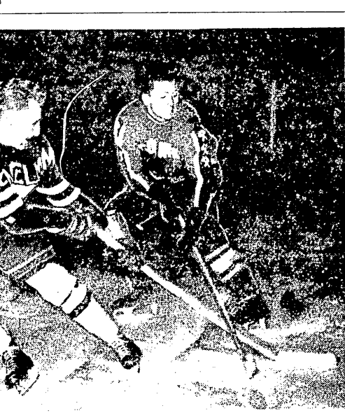
Hokeist katowickiego Górniku bawili w Wiedniu, gdzie rozegrali spotkanie z zespołem EKE. Na zdjęciu fragment meczu zakończony wynikiem nierozstrzygniętym 4:4

JESZCZE przed dwoma tygodniami sfinalizowałyśmy uczestnikom Konkursu-Plebiscytu, że rekord ilości kuponów z ub. roku będzie niewątpliwie pobity. Istotnie, został pobity 1 to w sposób tak najbardziej zaskakujący, gdyż przeszedł trzykrotnie. Do soboty włącznie otrzymaliśmy razem ważnych kuponów dokładnie 49.416! Oczekujemy jeszcze na listy, które z datą 31 stycznia na kopercie — zgodnie z warunkami Konkursu-Plebiscytu — nadejdą w najbliższych 2-3 dniach. Tak obrzydła ilość głosów jest gwarancją, że ostateczna lista plebiscyfica będzie istotnie „sprawiedliwa”. Obecnie w pośpiesznym tempie dokonujemy są obliczenia Wyniki Konkursu-Plebiscytu na „10 najlepszych sportowców i 5 najlepszych trenerów polskich w 1956 roku” ogłoszone będą na Balu Mistrzów Sportu.