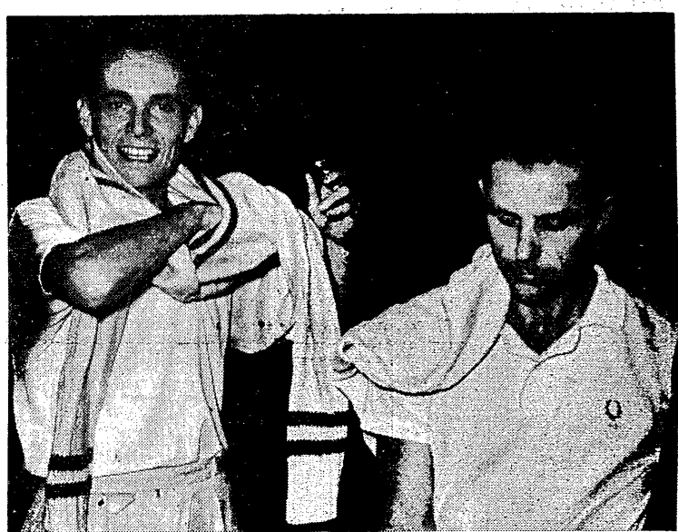
Asbóth i Skonecki po meczu, który zakończył się ciężko wywalczonym zwycięstwem Polaka.