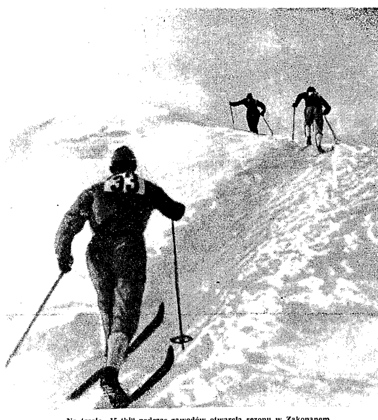
Na trasie „15-tki” podczas zawodów otwarcia sezonu w Zakopanem.