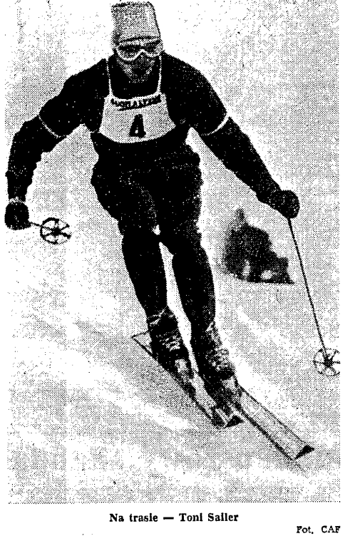
Na trasie - Toni Sailer