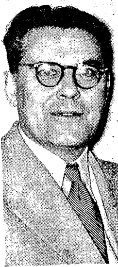
związyj str. 2