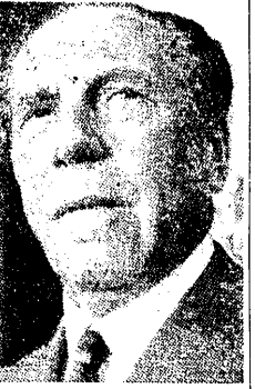
Dr Peco Bauwens, liczący sobie lat 70, jest najpopularniejszą postacią w piłkarstwie międzynarodowym. W tym miesiącu napisałem, że w Niemczech nie ma takiego zawodnika, który by nie był dobrym z grą.

W styczniu startujemy w Austrii, Francji, Włoszech, NRF i Szwajcarii.