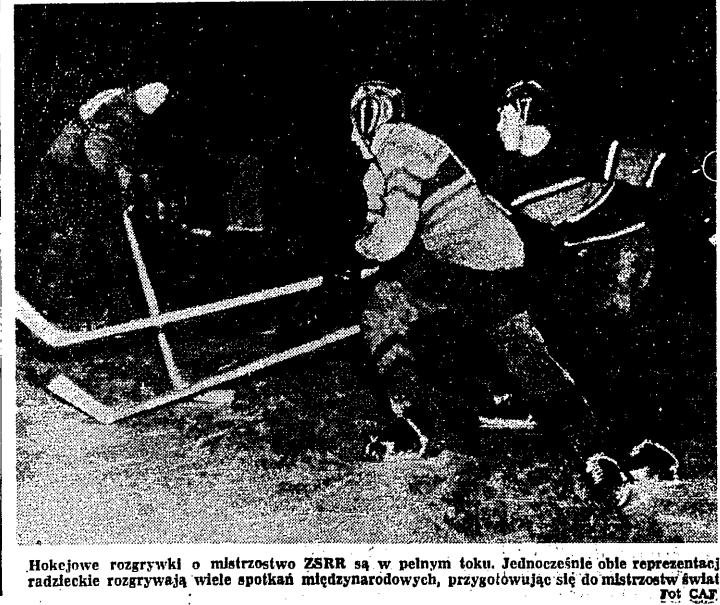
Hokejowe rozgrywki o mistrzostwo ZSRR są w pełnym toku. Jednocześnie obie reprezentacje radzieckie rozgrywają wiele spotkań międzynarodowych, przygotowując się do mistrzostw świata.

PODOBNO jak w roku ubiegłym, zwróciliśmy się do różnych czytelników i poprosiliśmy o wyrażenie opinii na temat 10 najlepszych sportowców polskiego w roku 1956. Właśnie, że w tym miejscu Drogosz, który nie wypadał na tym miejscu. Właśnie, że w tym miejscu Drogosz, który nie wypadał na tym miejscu.