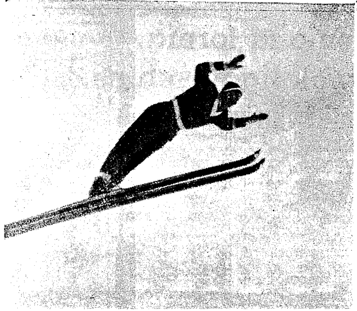
Władysław Tajner skacze coraz lepiej. W Garmisch-Partenkirchen zajął on 10 miejsce w doborowej stawce.

GARMISCH PARTENKIRCHEN, 21 (obsł. wł.). Rozegrany w Nowy Rok na olimpijskiej skoczni międzynarodowy konkurs skoków był już trzecim (po Oberstdorfie i Innsbrucku) etapem międzynarodowego niemiecko-austriackiego tygodnia skoków. Konkurs ten oczekiwany z olbrzymim zainteresowaniem zgromadził wokół skoczni około 30 tysięcy widzów. Główną atrakcją była zasygnalizowana już w Innsbrucku rewelacyjna forma skoczków radzieckich, którzy w Austrii odnieśli zdecydowane zwycięstwo. Pod tym względem publiczność się nie zawiodła. Na olimpijskiej skoczni w Ga-Pa nastąpił co prawda spodziewany kontrast Finów na czołowe pozycje, ale przewidywalny udział się tylko częściowo. Finowie wypadli wprawdzie dużo lepiej niż w Innsbrucku, lecz zwyciężyła i tym razem był skoczek ZSRR.