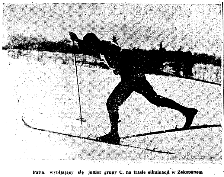
Fatta, wybijający się junior grupy C, na trasie eliminacji w Zakopanem

KATOWICE, 1.1. (tel. wł.). Na... Przebieg wstępu hokeistów