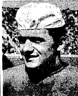
Cestari (Włochy) zajął VI miejsce