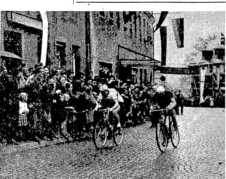
Na X etapie Schur (z lewej) i Dumitrescu przez długi czas jechali razem, doganiając uciekającą czołową grupkę kolarzy

BRNO, 14.5 (dalekopisem). Dzielny przedostatni etap IX Wyciągu Pokoju. Trasa Tabor-Brno, długości 177 km ze względu na ukształtowanie terenu będzie druga z kolei najtrudniejsza w Wyciągu po etapie Karl Marx Stadt - Karlovy Vary. Kolarze napotkali na niej wiele przeszkód i zjazdów. Typowy kraj obrosł podgórskimi lasami. Wzdłuż szosy były także wzniesienia, które przetrwały niebezpieczne momenty jazdy. Wśród kolarzy, którzy w klasyfikacji ogólnej dzielili różnicami pierwszeństwa, w tym samym czasie wzięli udział w wyścigu, byli: 1. Schur (NRD) — 4.38.33 (minus 1 minuta bonifikaty), 2. Cestari (Włochy) — 4.38.33 (minus 30 sek. bonifikaty), 3. Klewcow (ZSRR) — 4.38.43, 4. Kolev (Bułgaria) — 4.38.43, 5. Plank (CSR) — 4.38.53, 6. Ostergard, Dania — 4.39.15, 7. Czyżków, ZSRR — 4.39.15, 8. Bende, Węgry — 4.39.20, 9. Dumitrescu, Rum. — 4.39.31, 10. Romagnoli, Włochy — 4.42.13, 11. Novak (CSR) — 4.42.13, 12. Van t'Hof (Hol.) — 4.42.13, 13. Borva (Belg.) — 4.42.13, 14. Sanderson (Angli) — 4.42.15, 15. Funke (NRF) — 4.43.32, 16. Petrovic (Jug.) — 4.43.32, 17. Krivka (CSR), 18. Ravn (Dan.), 19. Wolfe (Norw.), 20. Butzen (Belg.), 21. Berg (Norw.), 22. Jacquier (Szwajc.) — 4.43.32, 23. R. Jacobs (Luk.), 24. Krutkowsk (ZSRR), 25. Meister I (NRD), 26. Baudechon (Belg.), 27. Svab (CSR), 28. Stolpek (NRD), 29. Anderson (Szwecja), 30. Molecuan (Rum.).