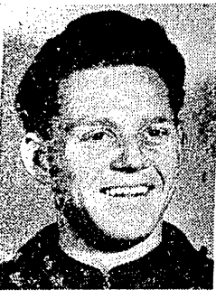
Zwycięzca XI etapu — Gustaw Schur

BRNO, 14.5 (dalekopisem). Dzielny przedostatni etap IX Wyciągu Pokoju. Trasa Tabor-Brno, długości 177 km ze względu na ukształtowanie terenu będzie druga z kolei najtrudniejsza w Wyciągu po etapie Karl Marx Stadt - Karlovy Vary. Kolarze napotkali na niej wiele przeszkód i zjazdów. Typowy kraj obrosł podgórskimi lasami. Wzdłuż szosy były także wzniesienia, które przetrwały niebezpieczne momenty jazdy. Wśród kolarzy, którzy w klasyfikacji ogólnej dzielili różnicami pierwszeństwa, w tym samym czasie wzięli udział w wyścigu, byli: 1. Schur (NRD) — 4.38.33 (minus 1 minuta bonifikaty), 2. Cestari (Włochy) — 4.38.33 (minus 30 sek. bonifikaty), 3. Klewcow (ZSRR) — 4.38.43, 4. Kolev (Bułgaria) — 4.38.43, 5. Plank (CSR) — 4.38.53, 6. Ostergard, Dania — 4.39.15, 7. Czyżków, ZSRR — 4.39.15, 8. Bende, Węgry — 4.39.20, 9. Dumitrescu, Rum. — 4.39.31, 10. Romagnoli, Włochy — 4.42.13, 11. Novak (CSR) — 4.42.13, 12. Van t'Hof (Hol.) — 4.42.13, 13. Borva (Belg.) — 4.42.13, 14. Sanderson (Angli) — 4.42.15, 15. Funke (NRF) — 4.43.32, 16. Petrovic (Jug.) — 4.43.32, 17. Krivka (CSR), 18. Ravn (Dan.), 19. Wolfe (Norw.), 20. Butzen (Belg.), 21. Berg (Norw.), 22. Jacquier (Szwajc.) — 4.43.32, 23. R. Jacobs (Luk.), 24. Krutkowsk (ZSRR), 25. Meister I (NRD), 26. Baudechon (Belg.), 27. Svab (CSR), 28. Stolpek (NRD), 29. Anderson (Szwecja), 30. Molecuan (Rum.).