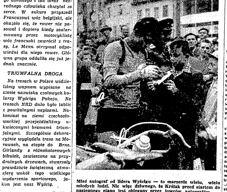
Mieć autograf od lidera Wyciągu — to marzenie wielu, wielu młodych ludzi. Nie więc dziwnego, że Królak przed startem do następnego etapu jest obłożony przez łowców autografów