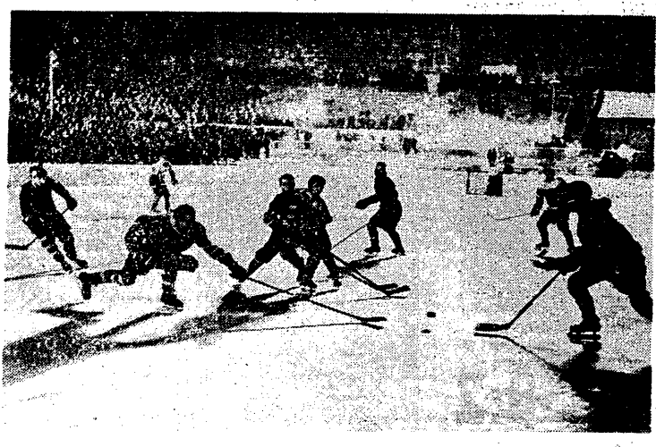
Na stadionie moskiewskiego Dynama hokeiści ZSRR zremisowali z drugą drużyną CSR 2:2. Na zdjęciu fragment tego spotkania.