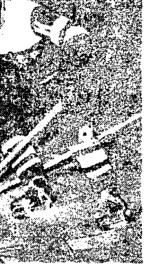
Kapitan reprezentacji drużyny ZSRR, W. Bobrow w akcji.

MOSKWA. W meczu hokejowym na lodowisku przy stacji Kozłowski (Czerwinski) pokonał na własnym lodowisku Spartak Moskwa 11:0.