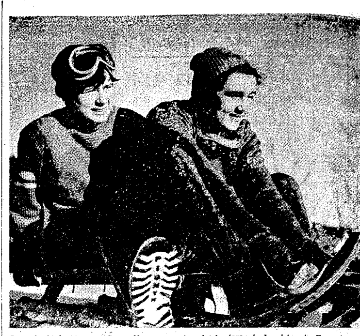
Saneckarki Zróbkowa i Gorgoniówna przygotowują się starannie do mistrzostw Europy, które tym razem odbędą się w Austrii.

W Cortinie odbyły się eliminacje w slalomie. Wśród uczestników w następującej kolejności: 1. M. Marchelli - 2:55,2; 2. Millante - 2:55,3; 3. Zechini - 2:57,4; 4. Burtini - 2:57,5; 5. Marchelli - 2:58; 6. Pöner - 2:58,4; 7. Poloni - 2:59,4; 8. Minuzza - 2:59,5; 9. M. Marchelli - 2:59,5.