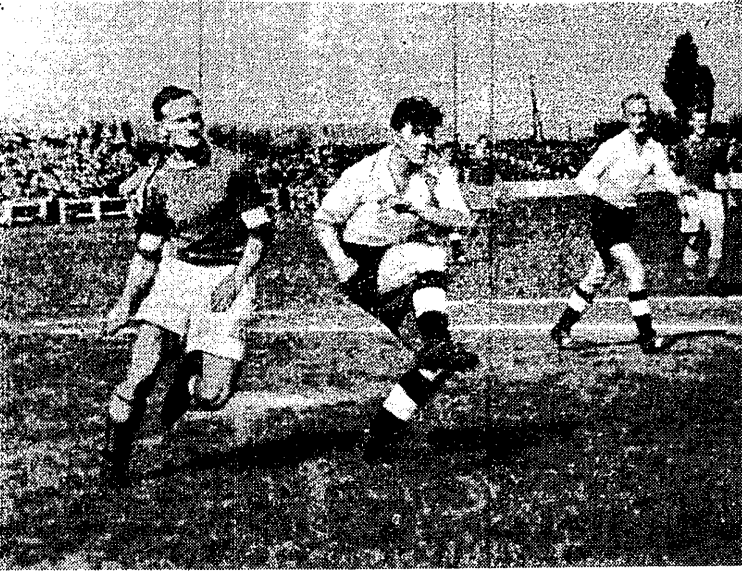
Kolejarz Poznań walczy o utrzymanie się w I lidze piłkarskiej. W niedzielę gra on na własnym boisku z chorowanskim Ruchem i trudno dziś przewidzieć, która drużyna wyjdzie zwycięsko z tego spotkania. Jedyną szansą Anioły (z lewej) może zadekretować o wyniku. Kolejarz przegrał pierwszy mecz w Chorzowie 0:3, ale w niedzielę będzie miał za sobą handicap własnego boiska i własnej publiczności. O tym, że w Poznaniu nie jest łatwo wygrać przekonała się m. in. bytomska Polonia, która niedawno straciła tam dwie bramki i dwa punkty. Fragment tego meczu przedstawia nasze zdjęcie

Coraz bliżej rozstrzygnięć w sprawie mistrzostwa i spadku