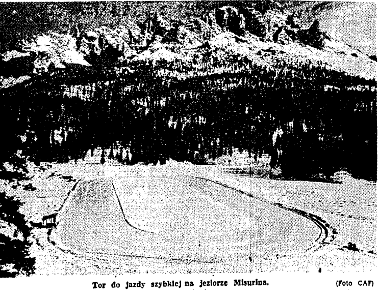
Tor do jazdy szybkiej na jeziorze Misurina.