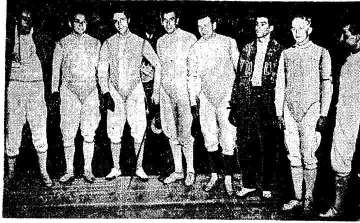
Wielkim sukcesem naszych szermierzy zakończyły się mistrzostwa świata we florecie... Polacy zakwalifikowali się do finału i zajęli czwarte miejsce.