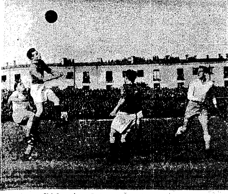
Fragment meczu Stal Sosnowiec - Ruch Chorzów, zakończonego wynikiem 1:1. Moment na przedpolu Ruchu.