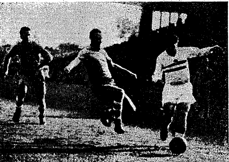
Przebieg Puskasa podczas meczu CSR — Węgry 1:3 Z lewej Hajsky, obok napastnika węgierskiego Hiedlik, a w tyle za Puskasem Menclik

Na ogół typuje się zwycięstwo Polaków w stosunku 15:5