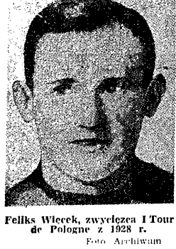
Feliks Wiećka, zwycięzca I Tour de Pologne z 1928 r.