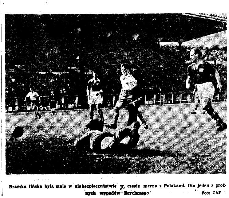
Bramka fińska była stale w niebezpieczeństwie, w czasie meczu z Polakami. Oto jeden z groźnych wypadków Brycznego.