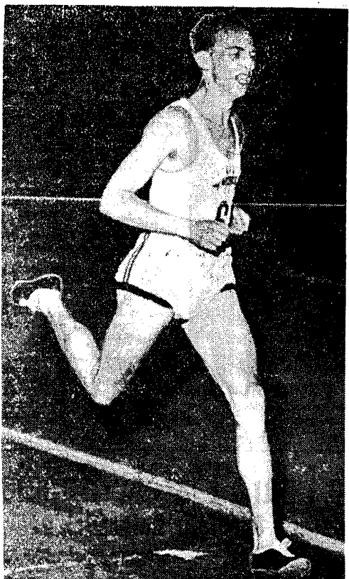
Audun Boysen (Norwegowie) doskonale średniol dystansowiec, rekordzista świata w biegu na 1000 m — 2:19,0, osiągnął także drugi czas w historii biegu na 800 m — 1:45,9.

Właściwie to nazwiska w tytule są... Feliks Wiećka, zwycięzca I Tour de Pologne z 1928 r.