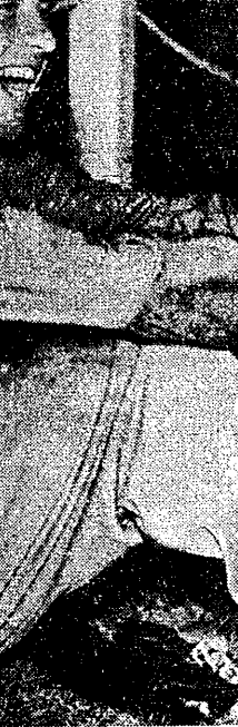
Emil Zatopek jeszcze raz udowodnił, że na 10.000 m jest bezkondykcjonalnie wygrywać z Pirie w czasie 29:25,6.