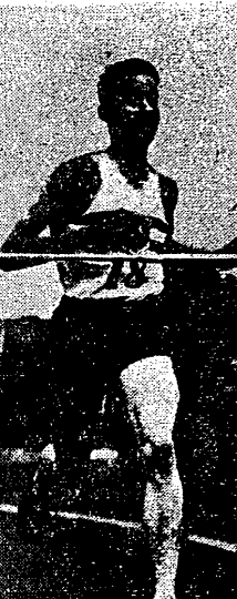
Gordon Pirie wygrał w Pradze z Zatopekem 5000 m w doskonałym czasie 14:03,8.

PRAGA, 15.9. (tel. wł.). W środę i w czwartek odbyło się w Pradze spotkanie lekkoatletyczne Czechosłowacji — Anglii. Spotkanie zakończyło się podwójnym zwycięstwem Anglii, w konkurencji mężczyzn 1:17,95 i w konkurencji kobiet 58:48. Anglicy zwyciężyli w 12 konkurencjach, zaś Czechosłowacy w 8. Angliki — w 6 konkurencjach. Czechosłowacy zaś w 4. Po pierwszym dniu prowadził Czechosłowacja w konkurencjach męskich 47:46. Ze względu na dyskwalifikację sztafety gości 4x100 m. Anglicy założyli protest, który został uwzględniony, wobec czego punktacja zmieniła się 51:44 na korzyść Anglików. Główne zainteresowanie skupiło się na pojedynku Pirie z Zatopekem. Zakończyły się one wynikiem 1:1, bowiem na 5.000 m triumfował Anglik, natomiast na 10.000 m — Czechosłowak.