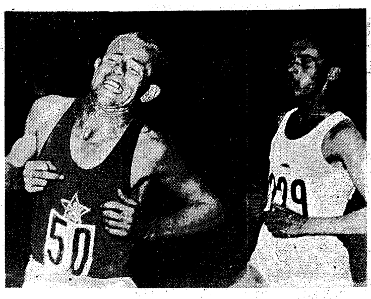
Zatopek biegnie jeszcze przed Iharosem, ale już niedługo Węgiel wyprzedzi wielkiego Czechę, który spadnie na szóstą pozycję.

Wielce się cieszyłem, że w tym roku na Hicie światowej Trójki wielki sukces Polaka miała wyniki również rewelacyjne: Iharos 13:56,6, Kovacs 13:57,6 i Szabo 14:00,6. Tak więc był to pierwszy w świecie bieg, w którym aż trzech zawodników jednocześnie uzyskało wyniki poniżej 14 min.