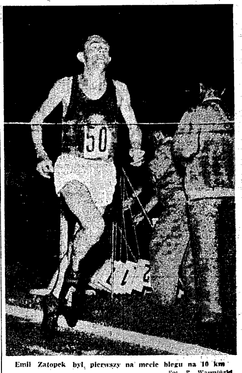
Emil Zatopek był pierwszy na mecie biegu na 10 km.

Zarówno spotkania eliminacyjne, jak i finałowe rozegrane zostaną w dniach 4, 5 i 6 sierpnia. Po dwóch najlepszych zespołach z każdej grupy (w tym z grupą przegranych) będzie miał miejsce mecz o 3 miejsce, zaś o 5 i 6 miejsce o 5 i 6.