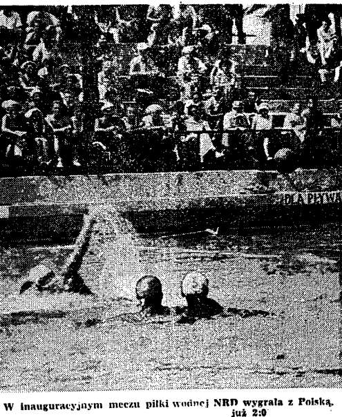
W inauguracyjnym meczu piłki wodnej NRD wygrała z Polską

W inauguracyjnym meczu piłki wodnej NRD wygrała z Polską. W inauguracyjnym meczu piłki wodnej NRD wygrała z Polską. W inauguracyjnym meczu piłki wodnej NRD wygrała z Polską.