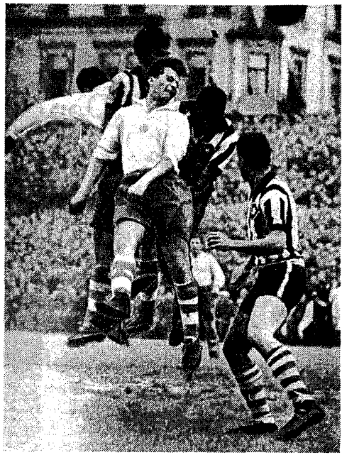
Brazylijska drużyna piłkarska Botafogo rozegrała w Czechosłowacji trzy mecze. W pierwszym spotkaniu Botafogo pokonała reprezentację Dynama 1:0. Na zdjęciu: fragment spotkania (piłkarze brazylijscy w pasiastych koszulkach)