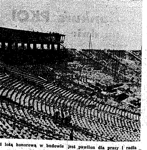
Roślinie stadion festiwalowy. Nad lożą honorową w budowie jest pawilon dla prasy i radia

Przed 1939 najlepiej prosperującym okręgiem PKKF był powiat w Zawadzie. W tym powiecie działało 400 PKKF. W tym powiecie działało 400 PKKF.