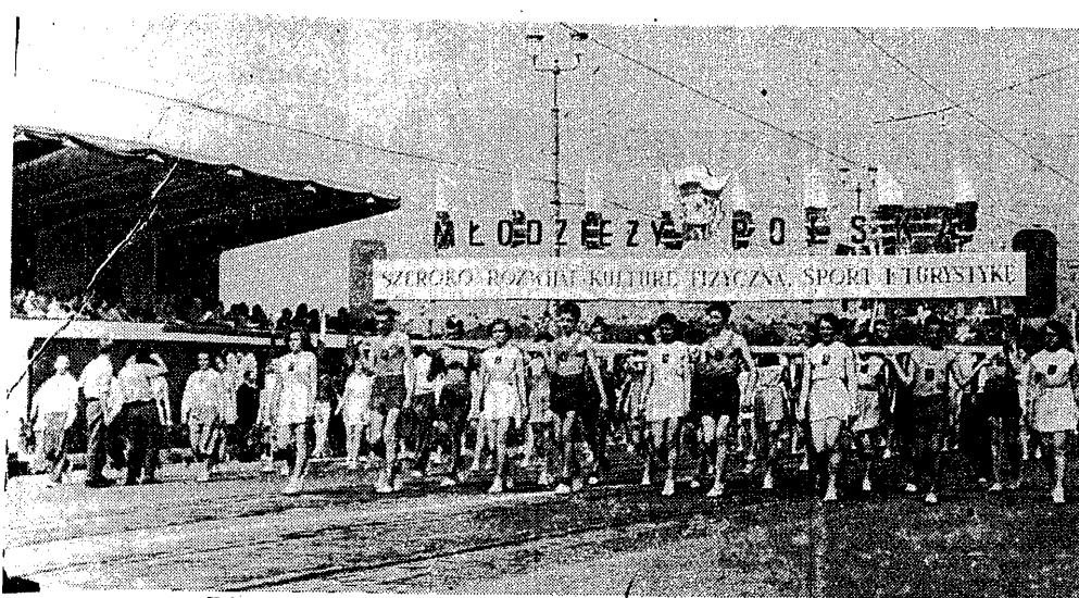
Kolumna sportowa defiluje w dniu 1 Maja przed trybuną honorową