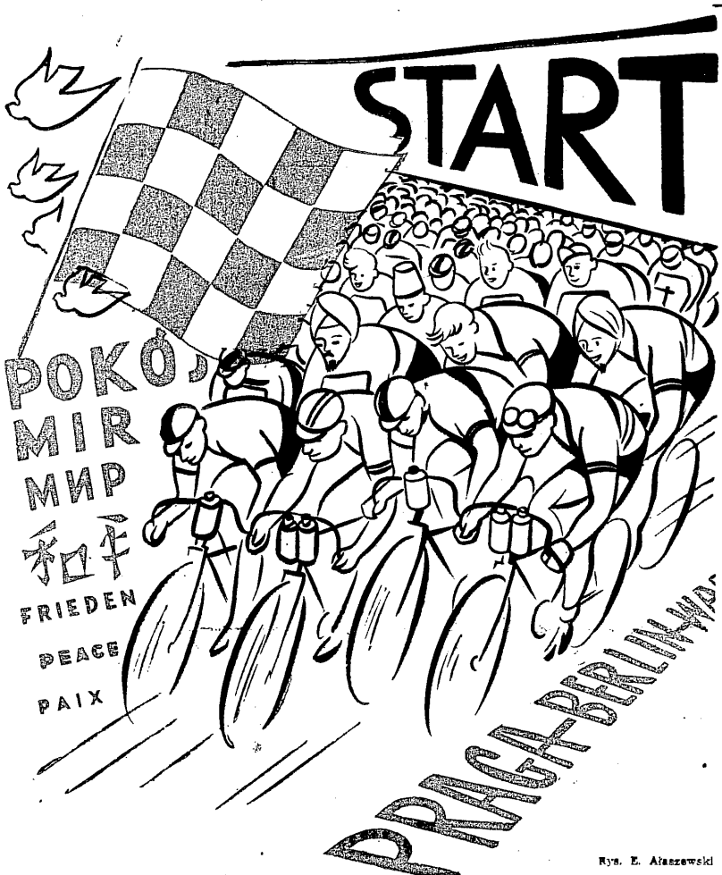
Rys. E. Alaszewski

Dalsze informacje o VIII Wyścigu Pokoju na str. 3 i 4.