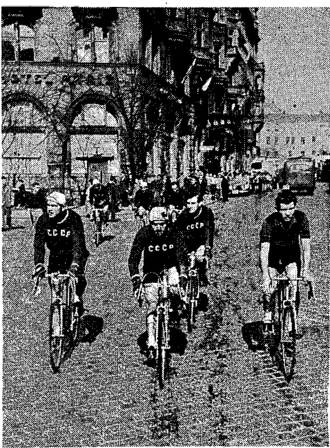
Kolarze radzieccy, przybywający już w Pradze wyruszają na kolejny trening

Po części oficjalnej czeskosłowacki Komitet Kultury Fizycznej podejmował uczestników Wyścigu i wszystkich zaproszonych gości w salach recepcyjnych. Na przyjęciu obecny był prezydent Zapotocky wraz z członkami rządu. Wieczór uświetlił w niezwykle serdecznej atmosferze i stanowił dalszy krok w zblizeniu i poznaniu się uczestników Wyścigu, którzy za dwa dni wyruszą na trasę Praga — Berlin — Warszawa.