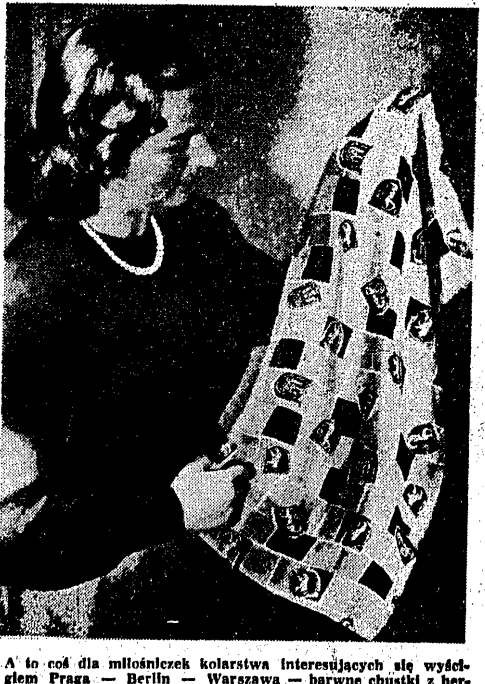
A to coś dla miłośników kolarstwa. Interesujących się wyścigiem Praga — Berlin — Warszawa — barwne chwile z herbatkami tych trzech miast.

BRUKSELA 26.4. (tel. wł.). Szermierze polscy uczestnicy V z VII w. Międzynarodowym turnieju szpadowym w miejscowości Huesy, przyjeżdżają do Brukseli we wtorek. W środy wyjeżdżają oni do Luksemburga na spotkanie z tamtejszymi szermierzami, które rozegrane będzie w czwartek. W piątek Polacy dadzą pokaz walk szermierczych w Liège dla miłośników Polonii.