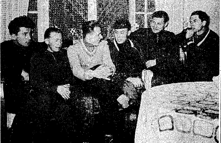
Śóstka najlepszych, ale tylko po pierwszym wyścigu eliminacyjnym. Już następnego dnia inni kolarze zasiadli na tej kanapie