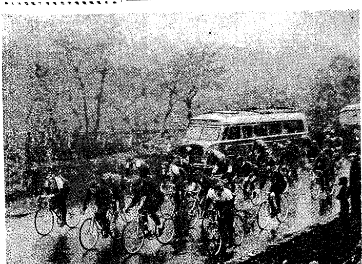
W chwilę po starcie do I eliminacji.