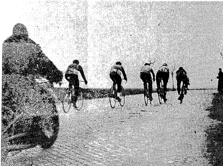
Czołówka ucieka... i nikt jej już nie dogoni aż do mety I eliminacji.