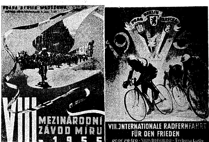
Plakaty Wyścigu Pokoju wydała CSRI i NRD