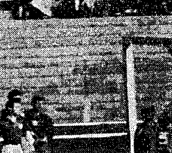
Pod bramką White Star znów flok, a w bramce... znów piłka.