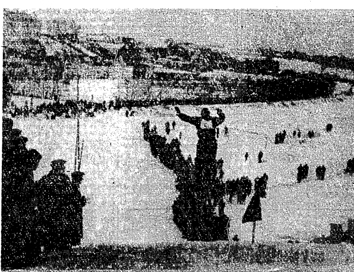
Lublinianie na otwarcie sezonu zimowego dostali piękny prezent — skocznię narciarską. W ubiegłą niedzielę na tej skoczni został rozegrany pierwszy konkurs skoków