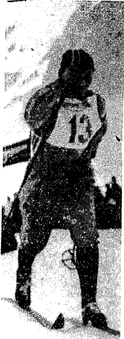
Marić Bukowa na trasie biegu