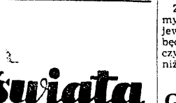
OCZY W USZY swiata