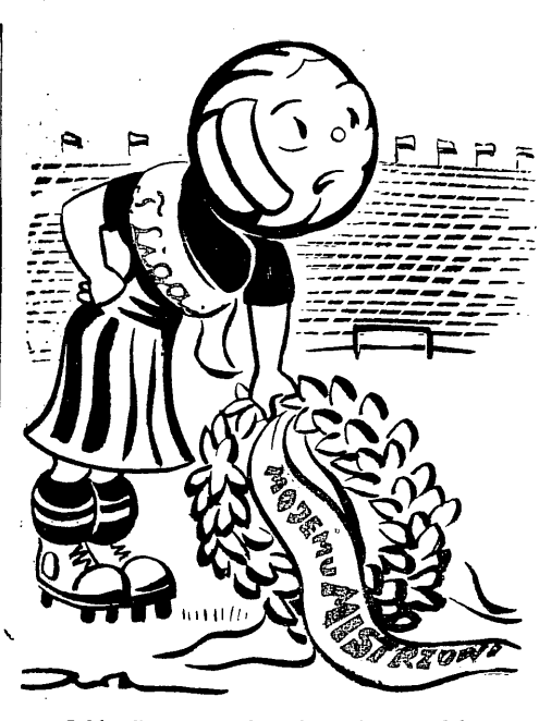
Jakże długo trzymają mnie w niepewności... Rys. E. Alaszewski

Austriacki Związek Bokserski zawiadomił GKFF, że nie może przysłać swojej reprezentacji na mecz z Polską B w projekowanym terminie - 28 listopada br. W związku z tym, mecz został przełożony na późniejszy termin, który nie został jeszcze ustalony.