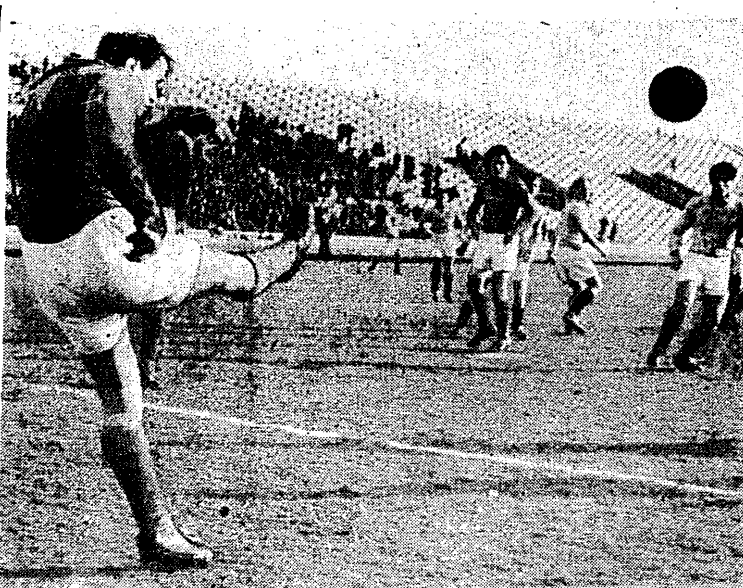
Jeden z najlepszych strzałów Baszkiewicz z warszawskiej Gwardii i tym razem nie doszedł do bramki bydgoskich gwardzistów

PASYWNA GRA NIEBEZPIECZNA MUSI BYĆ KARANĄ. NA OSTATNICH mistrzostwach świata w Szwajcarii było kilka wypadków kontuzji głowy zawodników, którzy z powodu niskiej wysokości brali piłkę ta częścią ciała. Dochodziło nawet do krótkich spieków między posiadaczami i zainwalniami lub siedziami. Uderzenia w głowę zawodników biegli (jeżeli miał jeszcze siłę i przytomność) do sedziska z prędkością nie odległą od gwizdów faulu, a jeżeli już odgrywał to zarządzał cały wolny w stronę bramki posiadawca. W polu czekali uczestników mistrzostw świata, szczególnie Poludniowo-amerykańscy i Turcy, siedziały by w tych wypadkach albo ignorancją w przepisach albo nieprzychylnie do tej zmiany nastawionymi. W drużynach europejskich wypadki takie były rzadkością. Sprawy te były ostatnio przedmiotem specjalnej narady Komisji Sedziwołskiej FIFA w Paryżu 15 dni temu. Jest pasywna gra niebezpieczna musi być karana na równi z aktywną. Za zawadzenie, który wykroczył przeciw przepisom, musi być ukarany nawet wówczas, jeżeli w następstwie tego wykroczenia on sam będzie posiadawcą. Przekład: zawodnik zagrywający piłkę głową poniżej pasa lub w obszarze przeciwnika może być karny w słowie przez przeciwnika zwracającego uwagę. Mimo, iż został sam posiadawcą, wykrócył przeciw przepisom i powinien być napomniany a jego