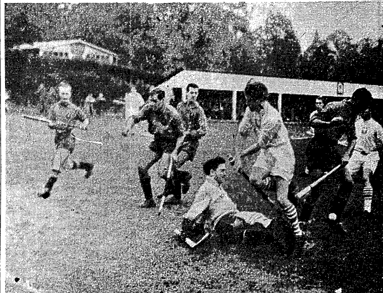
Polscy hokeiści na trawie atakują hiszpańską bramkę podczas meczu w Brukseli wygranego 3:2.