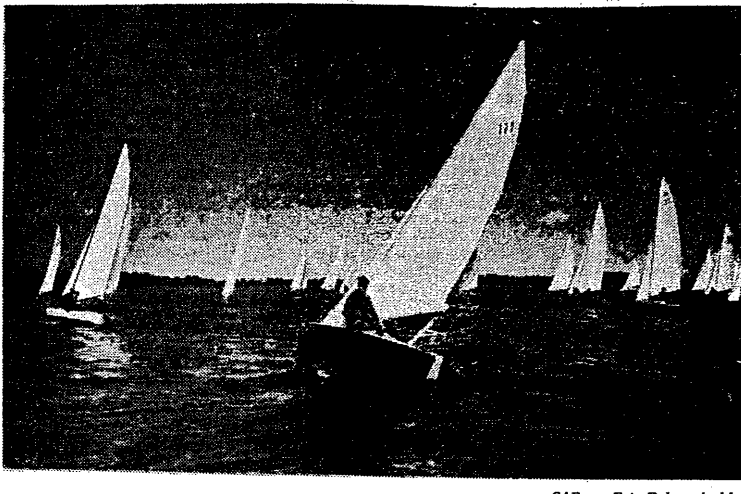
CAF — Fot. Dąbrowicki