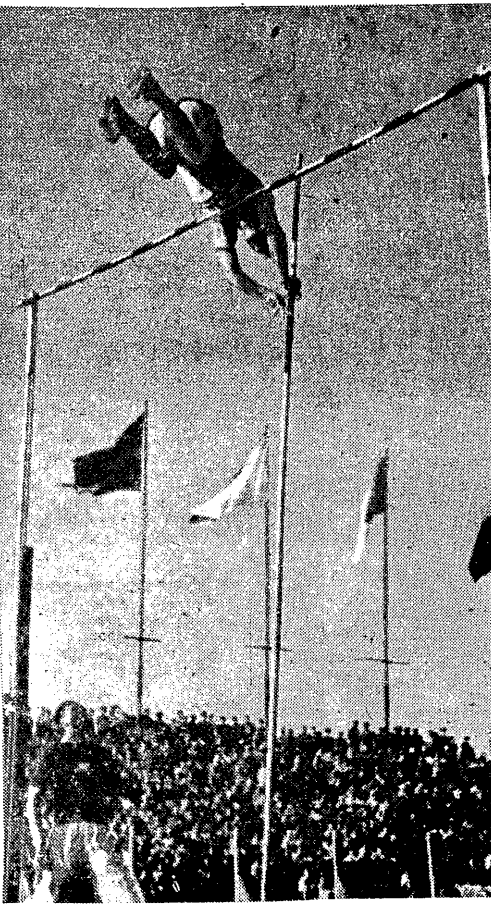
4.321 Taką wysokość pokonał w bieżącym sezonie w Europie tylko jeden zawodnik — Polak Edward Adamczyk i to dwukrotnie