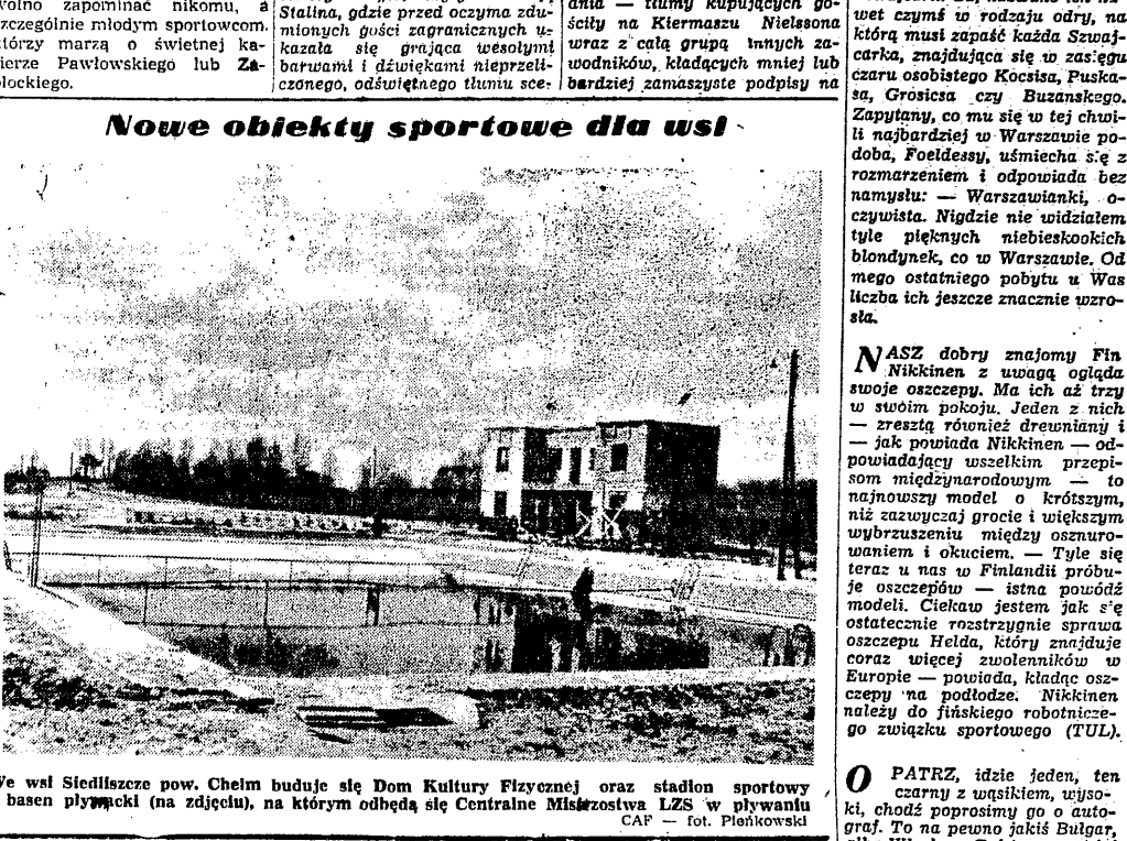
We wsi Siedliszcze pow. Cheim buduje się Dom Kultury Fizycznej oraz stadion sportowy i basen pływacki (na zdjęciu), na którym odbędą się Centralne Mistrzostwa LZS w pływaniu CAF - fot. Płanowski