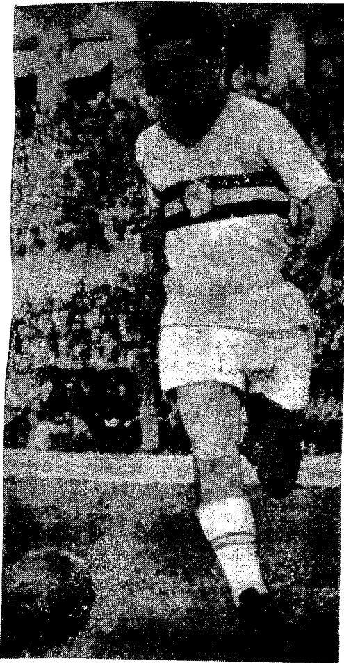
Za chwilę wspaniała „centra” w wykonaniu znakomitego lewoskrzydłowego reprezentacji Węgier — Csibora powędruje do środka, gdzie Puskas, Hidegkuti i Kocsis dokonają dzieła, które przyniesie bramkę