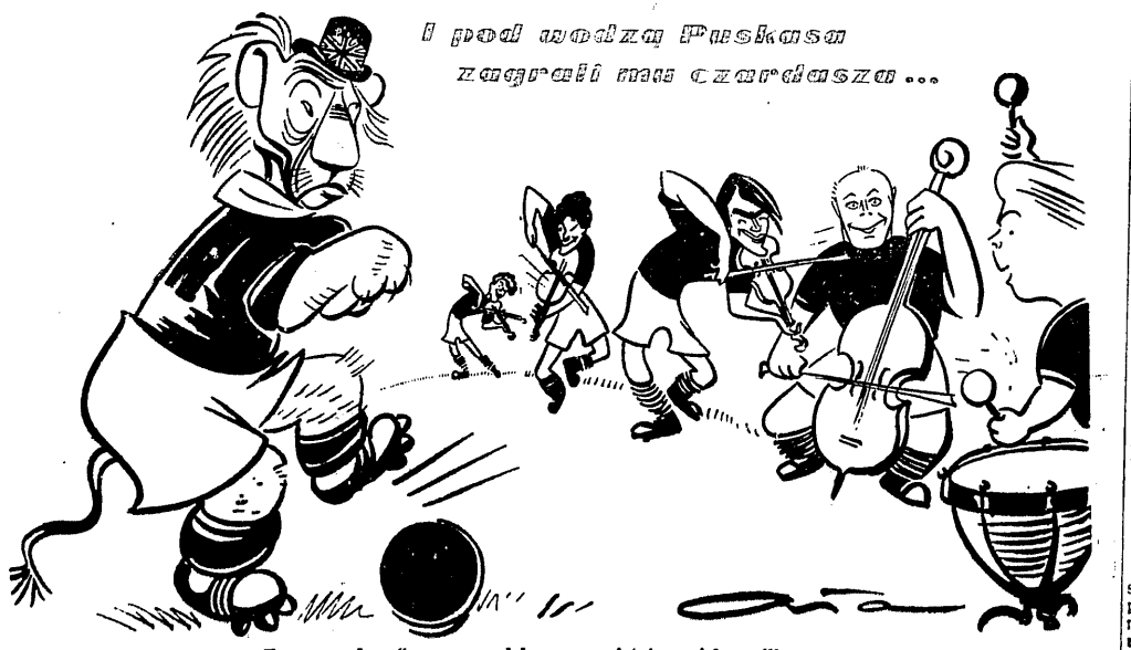
Tego „czardasza” na pewno dobrze zapamiętają angielscy piłkarze

ten lepszy jest od poprzedniego rekordu Polski, należącego do Klemińskiej o 4 sekundy. Dobry wynik uzyskał Gromowski na 400 m dow. — 4:47,6 oraz młody zawodnik poznański, Kozłowski — 5:07,6. Pozostałe wyniki: kobiety: 100 m dow. Cedro — 1:14,7; 400 m dow. Dzikówna — 5:53,0; 100 grzbiet. Wiśniewska — 1:23,5; 100 m żabką Ronczewska — 1:26,0; mężczyźni: 100 m grzbiet. Kozłowski — 1:14,0; 100 m mot. — Tokaczowski — 1:10,4; 200 m mot. Raczynski — 2:54,3 (rekord Polski Juniorów).