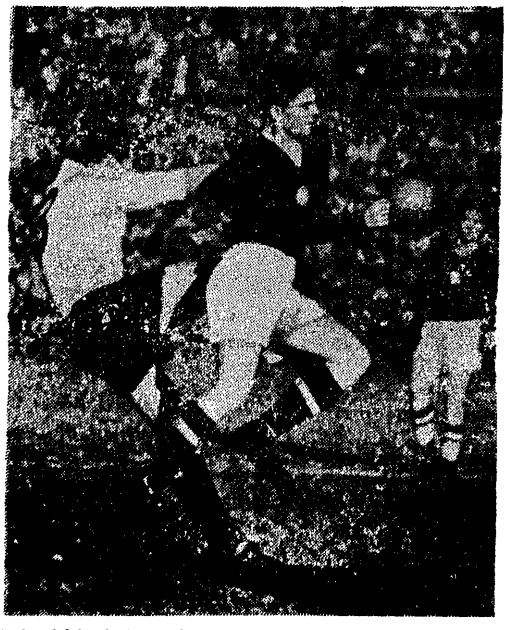
Ileż wdzięku i elegancji jest w tym przejściu czarodzieja piłki — Puskasa, który sprytnie ogrył Hanappi z Austrii i strzelił bramkę w zeszłorocznym meczu międzynarodowym, wygranym przez Węgrów 3:2

ZURICH 23.5. (obsł. wł.) W rozegranym w Lozannie międzynarodowym meczu piłkarskim mistrz świata — Urugwaj zremisował ze Szwajcarią 3:3 (1:1). W Bazyle rozegrany został w sobotę międzynarodowy mecz piłkarski drugiej reprezentacji Szwajcarii i Anglii. Nieoczekiwane zwycięstwo odniosła Szwajcaria 2:0 (1:0). WIEDEŃ 23.5. (obsł. wł.) Piłkarska drużyna Spartak (Praga) rozegrała dziś w Wiedniu mecz z drugą kadry Austrii. Zwyciężyła występująca jako reprezentacja Wiednia drużyna austriacka 2:0 (1:0).