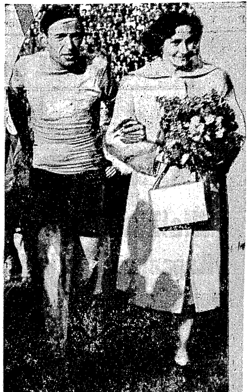
Młna niespodzianką okazała się czwórka Polaków, która przyjechała specjalnie aby zobaczyć najlepszego kolarza CSR