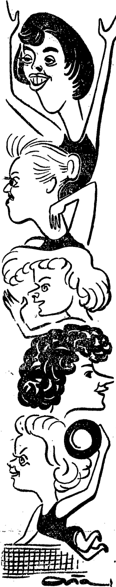
Siatkarki Bułgarii, które rozegrały szereg spotkań w Polsce...

W spotkaniach z zespołami Bułgarii w Lublinie