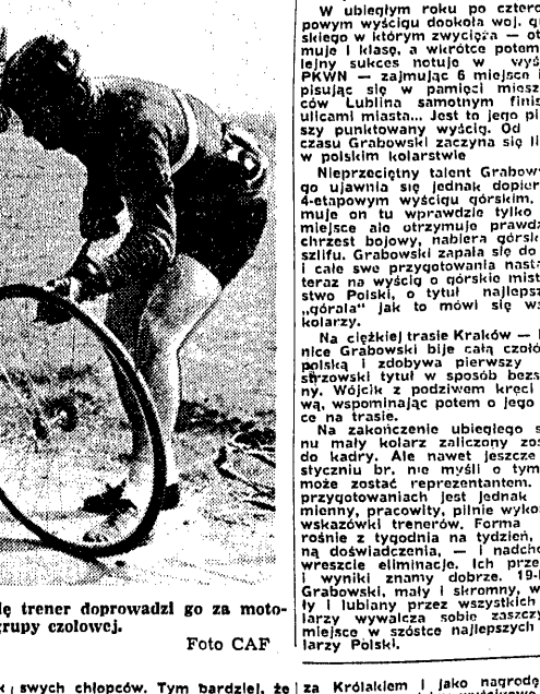
Lasak zmienia gumę. Za chwilę trener doprowadził go za motocyklem do grupy zaliczonej.