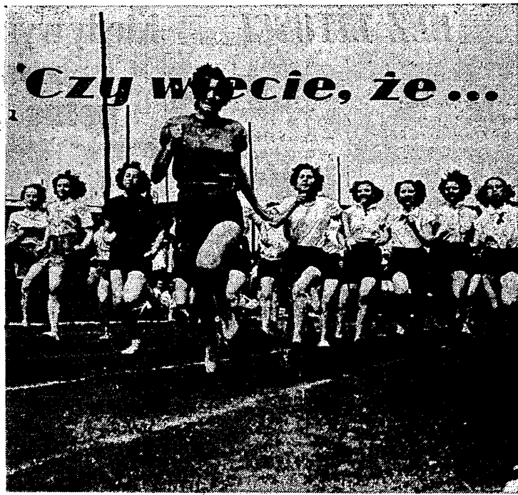
„W Biegach Narodowych... W Biegach Narodowych będzie do wadom zrozumienia przez szeregi członkowskie i aktyw Uchwały XIII Plenum ZG ZMP.

Choć ten sprawozdań po pierwszym występie pięściarzy