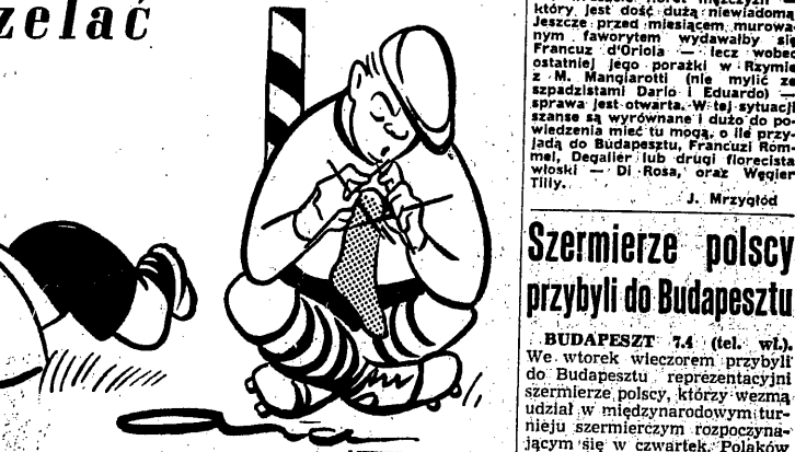
Szermierze polscy przybyli do Budapesztu

BUDAPESZT 7.4 (tel. wł.). We wtorek wieczorem przybyli do Budapesztu reprezentantami szermierze polscy, którzy wezmą udział w międzynarodowym turnieju szermierczym rozpoczynającym się w czwartek. Polaków witali na dworcu przedstawiciele Węgierskiego Komitetu Kultury Fizycznej oraz węgierscy szermierze.