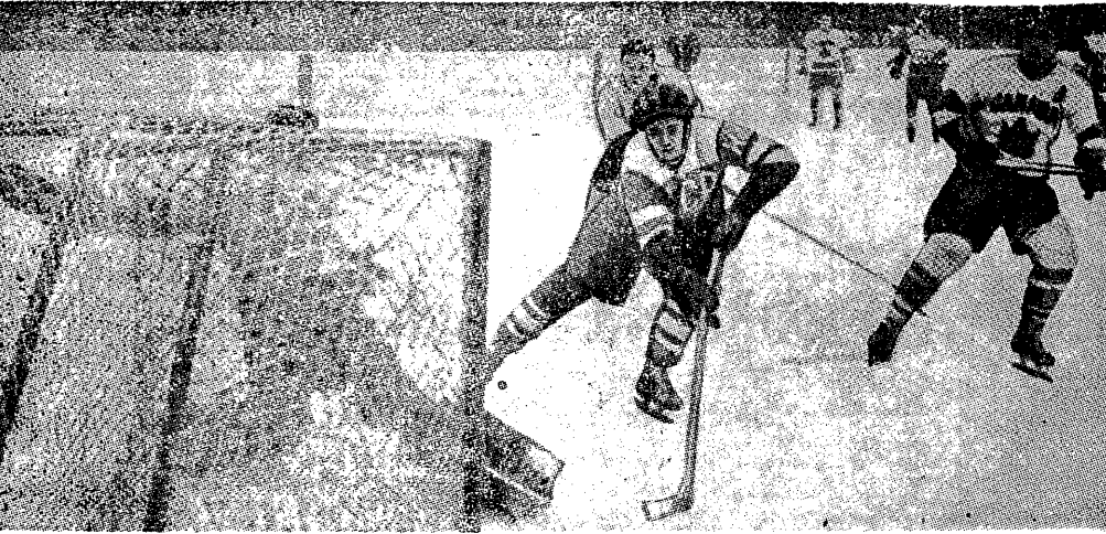
W poniedziałkowym numerze codziennej (niesportowej) szwedzkiej gazety „Stockholms Tidningen” zamieszczono przez całą szerokość pierwszej strony tytuł „Związek Radziecki deklaruje Kanadę 7:2 w mistrzostwach świata”...