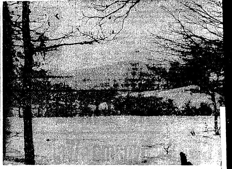
Trasa 8-A Narciarskiego Raidu Sudeckiego prowadzić będzie w Górah Sowiach z Witkova przez Trójgarb...