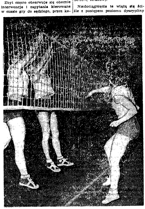
Moment ze spotkania siatkarek Kolejarza Gdańsk i AZS AWF W-wa...