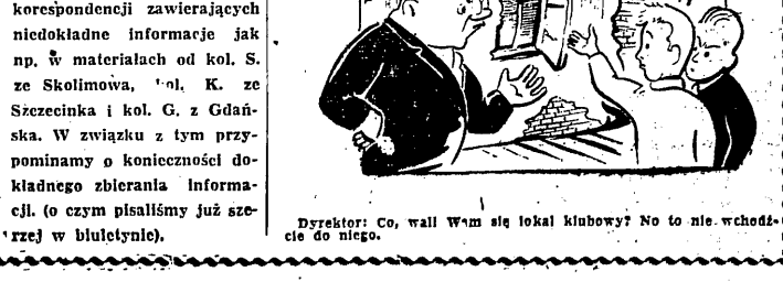
Dyrektor: Co, walił wam się lokal klubowy? No to nie wchodzić do niego.