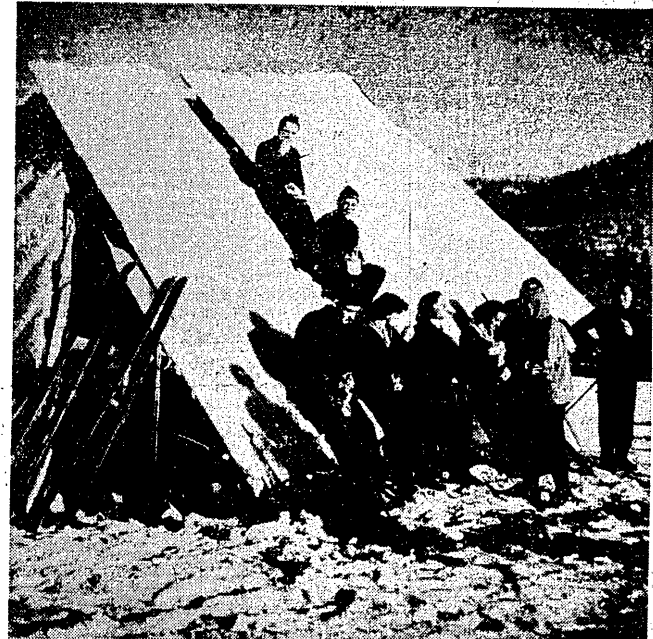
Czołowi narciarze Polski i NRD przebywają na obozie treningowym w Zakopanem. Na zdjęciu widzimy zjazdowców, wypoczywających przy szalście na Kalatówkach.

obejmujące szkolnictwo zawodowe (CUSZ) W sprawie nazwy nowego zrzeszenia mogą się wypowiedzieć Czytelnicy „Przeglądu Sportowego" w Błyskawicznym Konkursie-Plebiscycie Szczegóły w najbliższych numerach