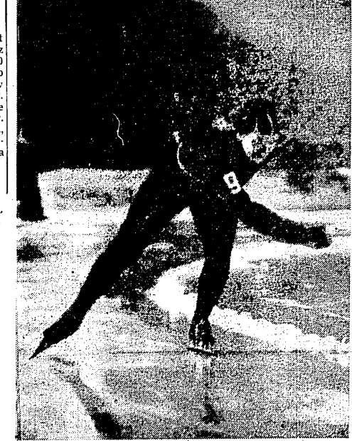
Zinaida Kriolowa czołowa łyżwiarka radziecka.