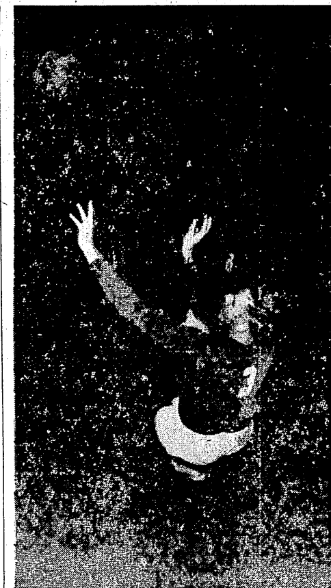
Najważniejsze jest uratowanie drużyny przed stratą punktu. Siedów robi to ofiarne i trzeba przyznać bardzo efektywne.