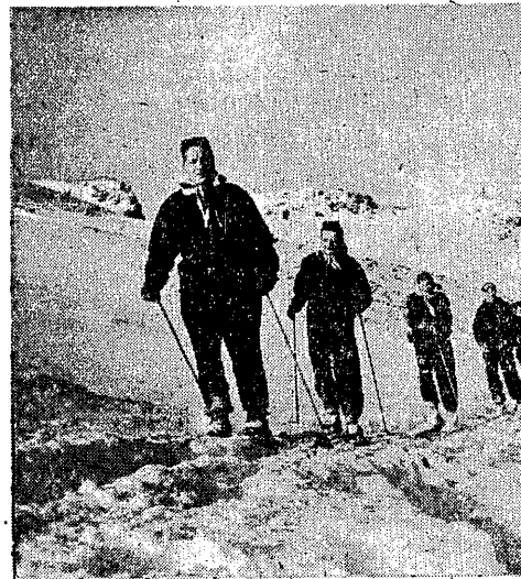
doświadczeniom nabytym w I Raidzie, na pewno ulegnie jeszcze znacznej poprawie.