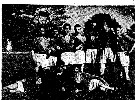
Zespół piłkarski LZS Drzewce Stare.