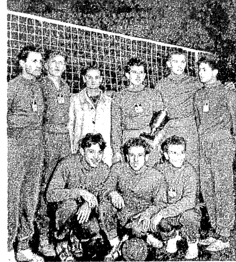
Drużyna siatkarzy AZS-AWF, która zdobyła mistrzostwo Polski, spotka się niebawem ze znakomitymi siatkarzami radzieckimi, którzy przyjadą do Polski.

Przyjazd zawodników radzieckich przyczyni się nie tylko do zbliżenia sportowców Polski i ZSRR, lecz również do podniesienia poziomu sportowego i ogólnego naszych zapaśników i siatkarzy.