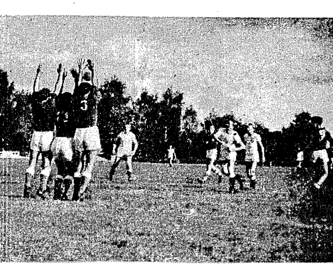
Zawodnicy AZS AWF robiła tzw. "mur" w obronie rzutu wolnego w meczu piłki ręcznej z AZS Katowice...