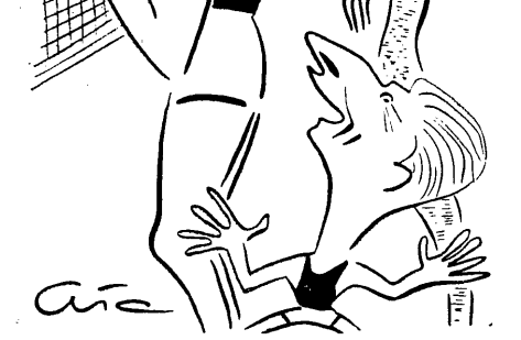
Trójka czolowych siatkarzy czechosłowackich: dwumetrowy Te...

Przebieg poszczególnych partii był następujący: (na I meczu Polska): I partia - 5:0, 9:3, 6:3, 6:6, 7:7, 13:7, 13:8, 15:8, II partia - 1:0, 1:1, 2:2, 5:2, 5:4, 6:4, 6:5, 13:5, 13:7, 14:7, 14:8, 15:8, III partia - 0:1, 1:1, 2:1, 2:2, 9:2, 9:3, 10:3, 10:5, 12:5, 12:6, 13:8, 13:8, 15:8.